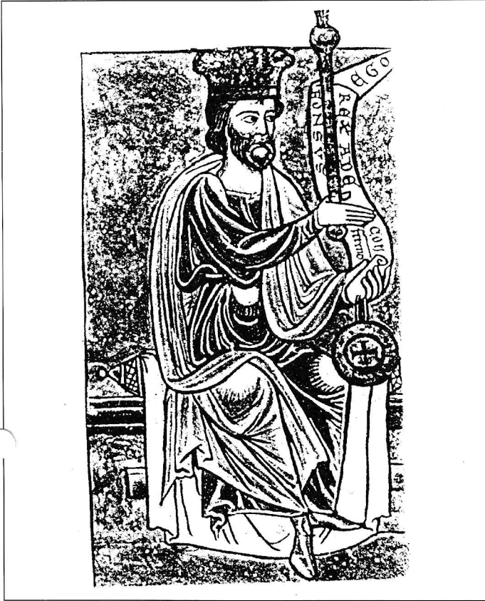
Alfonso VI -Conquistador del territorio de Getafe