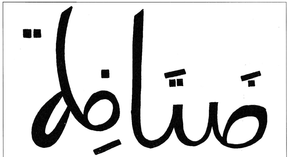
Gráfica Árabe de Getafe

En el Archivo de Madrid varios documentos nos prueban su existencia. El más significativo quizás sea "El Padrón de los Pechos de Getafe de 1497", documento fiscal donde aparece el nombre de los 77 vecinos Pecheros (que pagan impuestos o "Pechos") que había en Getafe en aquel tiempo. Por este documento podemos deducir una población real de alrededor de 1.000 personas que están preparando el gran desarrollo del siglo XVI. Pero esto será asunto de otro artículo. ■